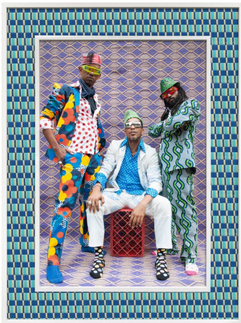
Une oeuvre de Hassan Hajjaj